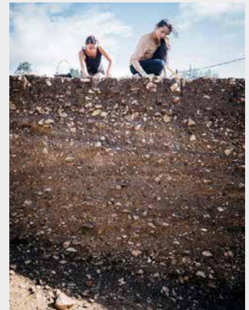
Le site du théâtre est toujours en cours d'étude. Fouilles archéologiques et chantier de restauration sont régulièrement organisés.