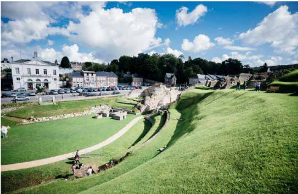
Vue générale sur l'arène et les gradins du théâtre