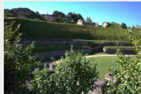
Vue depuis le petit jardin du théâtre

Renseignements et réservations au 02 35 15 69 11 ou sur musees.departementaux@seinemaritime.fr (du lundi au vendredi)