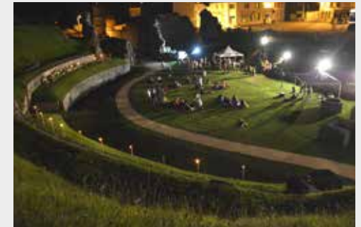
Une programmation d'animations et d'événements pour découvrir le théâtre autrement.