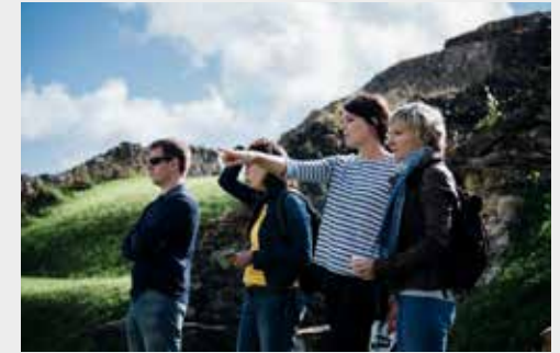
Des visites guidées par des conférencières passionnées par l'art et l'histoire